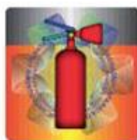
Slika 5. Izgled holograma u prirodnoj veličini